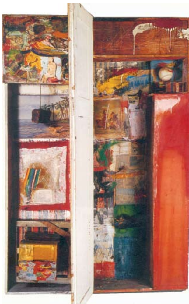
Robert Rauschenberg , Intervju , 1955, razni materiali na lesu, 185 cm x 125 cm

V šestdesetih letih XX. stoletja so mnogi umetniki ponovno oživili zanimanje za asemblaž in dadaizem nasploh. Dela Roberta Rauchenberga , Jasperja Johnsa , Fernadeza Armana ali Cezarja se vsaka na svoj način in v duhu časa napajajo pri idejah dadaizma in Schwittersovi uporabi zavrženih objektov. V slednjih so našli novo lepoto (včasih ne brez ironičnega podtona), ki jim jo je podaril kontekst, v katerega so predmete vključili ali jih zanj spremenili. Nasprotno danes, v času rastoče ekološke zavesti na eni in grozljive hiperprodukcije odpadkov na drugi strani, umetniki v smeteh in zavrženih predmetih ne iščejo estetske vrednosti, ampak skušajo z njihovo vključitvijo v polje umetnosti opozoriti na rastoče okoljske in družbene probleme. Gledalca zato običajno nagovarjajo z jezikom likovnih inštalacij, radikalnih posegov v prostor, najsi bo galerijski, javni ali zasebni. Seme take likovne govorice je zasejal Schwitters s svojim manično utopičnim projektom Merzbau . Tako kot so nam o obstoju slednjega ostali le fotografski dokumenti, tudi za mnogimi inštalacijami ostane le video ali fotografski zapis s statusom umetniškega dela.