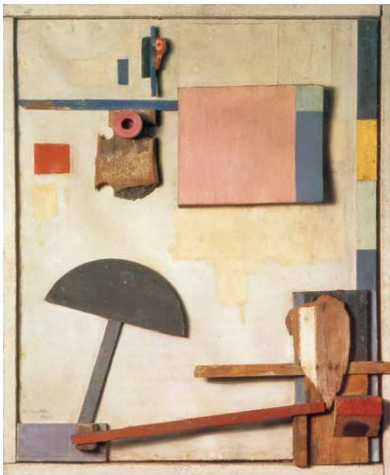
Kurt Schwitters, Merzbild Kijkduin , 1923, razni materiali na lesu, 74,3 cm x 60,3 cm

= slika), so odpadki, ki so ga pritegnili zaradi svojih otipnih ali optičnih lastnosti, pri čemer je imelo pomembno vlogo načelo slučajnosti, tako tipično za dadaistična dela. Umetnik je včasih tako najdene kose vključil v poslikano podlago, spet drugič vanje ni posegal z lastnimi estetskimi popravki, temveč je svoje asemblaže (kot imenujemo takšna dela) sestavljal na podlagi »danih dejstev«, z izborom najdenega in iskanjem ustreznega. Po nosilcu jih je razporedil s pretanjenim občutkom za likovno kompozicijo, ki lahko (ni pa nujno) kot celota ali v posamičnostih sugerira določeno idejo ali občutek. Schwitters se je odrekel kakršni koli sporočilnosti svojih slik, rekoč, da je sporočilo umetnost sama, saj ima vsaka linija, oblika ali barva svoj izraz, ki se gradi z različnimi kombinacijami, ni pa ga možno prevesti v besede. S čistim in neobremenjenim pogledom je našel lepoto v zavrženih in neuporabnih rečeh in z otroško nedolžnost-